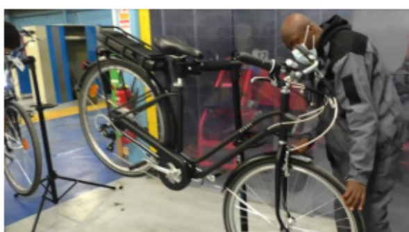
Le vélo électrique